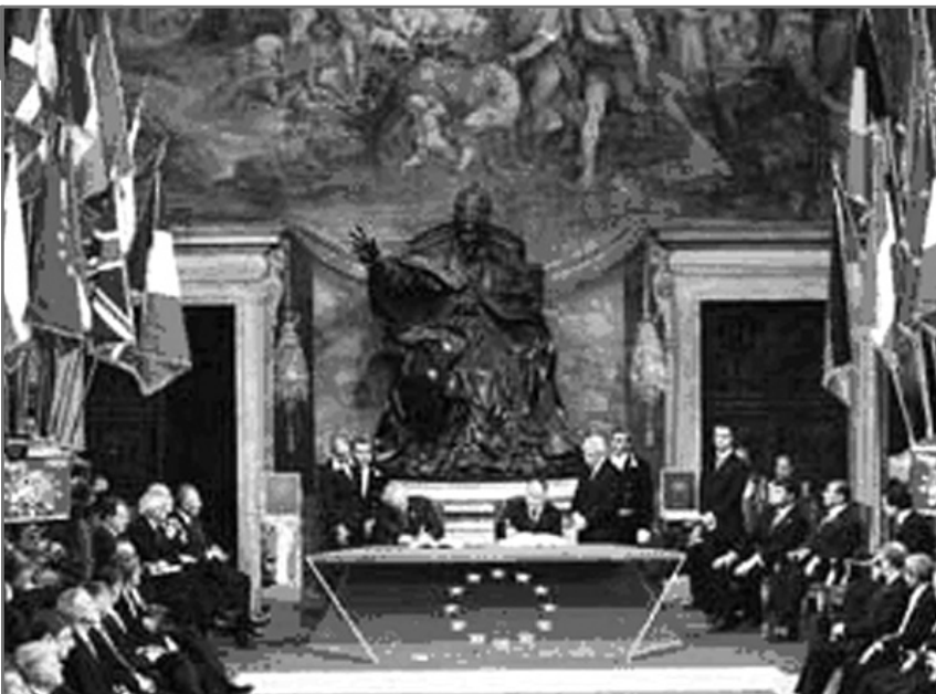
Semnarea la Roma, în Palatul Conservatorilor (Sala Horaților și Curiaților), a Tratatului de instituire a unei Constituții Europene (29 octombrie 2004). ( www.museicapitolini.org/en/eventi/evento_cost... )

Șefii de stat și de guvern și miniștrii afacerilor externe ai țărilor membre și țărilor candidate au semnat Tratatul de instituire a unei Constituții europene (29 octombrie 2004). Constituția trebuie să înlocuiască tratatele pe baza cărora funcționează Uniunea Europeană. Tratatul va intra în vigoare când va fi adoptat de țările semnatare. În Franța și Olanda, Constituția europeană a fost respinsă prin referendum, ceea ce înseamnă că, cel puțin deocamdată, această Constituție nu va funcționa.