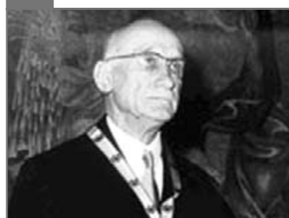
Robert Schuman

Robert Schuman (1886-1963). Este considerat unul dintre fondatorii Uniunii Europene. În timpul celui de-al doilea război mondial a participat la mișcarea de rezistență din Franța împotriva ocupantului german. După război, a îndeplinit funcțiile de ministru de finanțe (1946) și prim-ministru în guvernul Franței. Activitatea cea mai intensă a dus-o în calitate de ministru de externe în guvernul francez (1948-1952). În această calitate a lansat vestitul „Plan Schuman” în data de 9 mai 1950, prin care s-a declanșat procesul de unificare a Europei. Ziua de 9 Mai este sărbătorită drept Ziua Europei.