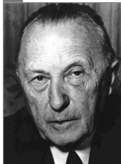
Konrad Adenauer