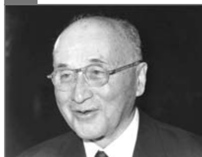
Jean Monnet

Jean Monnet (1888-1979). Alături de alt francez ilustru, Robert Schuman, poate fi considerat unul dintre părinții Europei unite. A prezidat, imediat după terminarea ultimului război mondial, comitetul care a realizat planurile de modernizare și reechipare a industriei franceze („Planul Monnet”). A jucat un rol de seamă în elaborarea „Planului Schuman”, în urma căruia a luat naștere Comunitatea Europeană a Cărbunelui și Oțelului (CECO), fiind primul său președinte. În 1956 a organizat o fundație care milita pentru ideea Statelor Unite ale Europei. După moarte, osemintele sale au fost transferate în Panteonul din Paris, locul care adăpostește rămășițele celor mai iluștri fii ai Franței. Despre personalitatea lui Jean Monnet, unul dintre diplomații iluștri ai secolului al XX-lea, Henry Kissinger, scria: „Puțini oameni au jucat un asemenea rol în istoria lumii.”