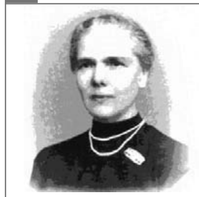
Elisa Leonida Zamfirescu ( www.csc.matco.ro/elisa.html )

Elisa Leonida Zamfirescu (1887-1973), prima femeie inginer din lume. S-a născut în anul 1887 la Galați. A urmat școala primară la Galați și studiile medii la vestita Școală Centrală din București. A vrut să devină ingineră încă de pe băncile liceului, dar nu a fost admisă la Școala de Poduri și Șosele, deoarece această instituție nu primea decât băieți. Totuși, a studiat la Academia Regală Tehnică de la Berlin (1909-1912), unde a fost primită condiționat, în mod excepțional. Aici a obținut diploma de inginer în anul 1912, fiind prima femeie inginer din Europa și chiar din lume. A lucrat ca șefă a laboratoarelor la Institutul Geologic al României timp de mai bine de 40 de ani (1920-1963). A elaborat metode noi de analiză cu ajutorul cărora a avut contribuții excepționale la cunoașterea resurselor minerale ale țării.