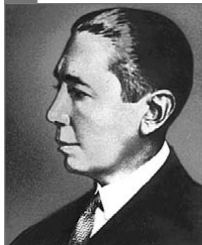
Nicolae Titulescu ( http://domino.kappa.ro/guvern/diverse.nsf/toate/ist_ilustrata/$file/75.jpg )

Nicolae Titulescu (1882-1941). A fost o excepțională personalitate a diplomației românești în perioada dintre cele două războaie mondiale. S-a născut la Craiova. A urmat cursurile celei mai vestite școli din oraș, Colegiul Național „Carol I”, pe care l-a absolvit cu media maximă. A fost premiant de onoare al faimoasei școli din Craiova. A urmat Facultatea de drept la Paris, pe care a absolvit-o cu brio, susținându-și și doctoratul. Îmbrățișând cariera universitară, a fost profesor de drept la universitățile din Iași (1907) și București (1909). A intrat în politică, fiind ales deputat în Parlamentul României (1912). A îndeplinit funcția de ministru de finanțe (1917, 1920-1921). A participat la Conferința de Pace de la Paris, ca reprezentant în delegația României. Numit delegat permanent la sesiunile Societății Națiunilor (1920-1936), a fost ales de două ori consecutiv (1930, 1931) președinte al Societății Națiunilor. A îndeplinit funcția de ministru de externe al României (1927-1928, 1932-1936). În activitatea sa, Nicolae Titulescu a fost un mare apărător al păcii și al intereselor României. Prin ideile privind „spiritualizarea frontierelor” în scopul intensificării cooperării între popoarele continentului nostru, Titulescu poate fi considerat un pionier al ideii europene.