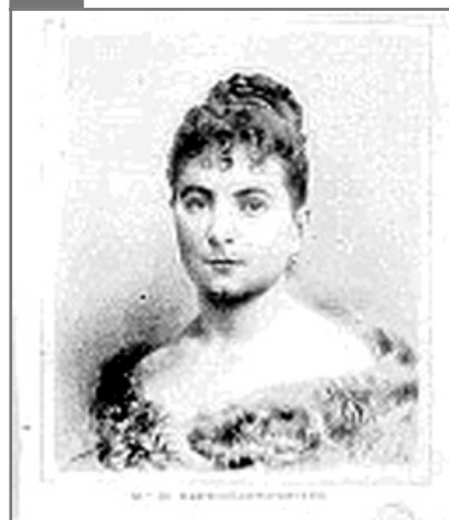
Haricleea Hartulary

Prima Tosca. Haricleea Hartulary (1860-1939) a fost numită Darclée de către marele compozitor francez Camille Saint-Saens. Născută la Brăila, a fost una dintre cele mai vestite soprane ale epocii sale. A fost prima interpretă a faimosului rol al Toscăi din opera cu același nume compusă de Giacomo Puccini (1900). Între prietenii marii cântărețe române s-a numărat un alt mare compozitor, Leoncavallo.