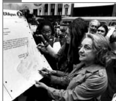
Betty Friedan

Betty Friedan s-a născut în anul 1921. Deși a beneficiat de o educație aleasă (a absolvit în 1942 Colegiul Smith și după un an Universitatea California din Berkeley), după ce s-a măritat a renunțat la slujbă. Nemulțumită de această viață, a scris o carte faimoasă, apărută în 1963: The Feminine Mystique (Mistica feminină), în care arăta că femeile sunt discriminate, militând pentru un nou statut al femeii în societate.