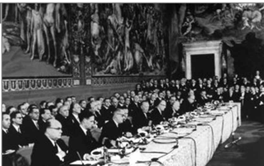
Semnarea Tratatului de la Roma, 25 martie 1957. ( http://content.answers.com/main/content/wp/en/thumb/b/b8/300px-Rometreaty.jpg )

Integrarea europeană reprezintă unul dintre cele mai importante fenomene pe care le cunoaște continentul nostru. Dacă inițial procesul urmărea, în primul rând, eliminarea pericolului unui nou război, ulterior s-au evidențiat numeroase avantaje ale creșterii cooperării între statele europene. Prosperitatea statelor membre și rolul din ce în ce mai important pe care instituțiile europene l-au jucat în viața economică și în relațiile internaționale au atras un număr din ce în ce mai mare de membri și au adâncit procesul de integrare. În zilele noastre, sute de milioane de oameni sunt cetățeni ai statelor membre ale Uniunii Europene; viața cotidiană a acestora este influențată de deciziile organismelor supranaționale de la Bruxelles și Strasbourg. Fundamenul integrării l-a constituit respectarea unor valori, în prim plan fiind cele legate de drepturile omului și de respectarea demnității umane. Așa cum se arată în preambulul Declarației universale a drepturilor omului , adoptată la 10 decembrie 1948, respectarea drepturilor omului constituie o garanție a păcii și cooperării internaționale, deci și a reușitei fenomenului de integrare europeană. Informații suplimentare legate de această temă se întâlnesc în prezentul material în modulele Cooperare și conflict – tema Pași către integrare (perspectiva românească – NATO-UE) și Mesajele culturii – tema Globalizarea .