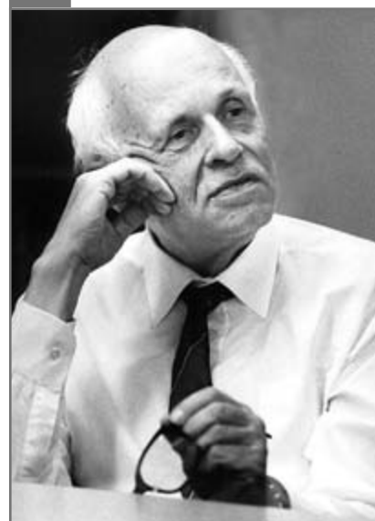
Andrei Saharov