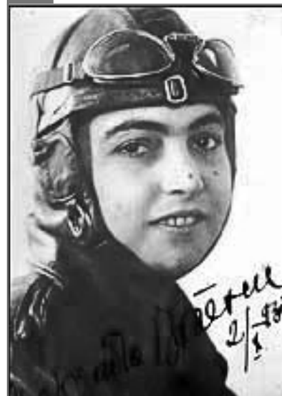
Smaranda Brăescu

Smaranda Brăescu (1897-1948), recordmena mondială absolută. A fost o remarcabilă personalitate, datorită căreia în străinătate s-a vorbit cu admirație despre România. La vârsta de 31 de ani a realizat primul salt cu parașuta, în Germania, și a primit brevetul de parașutist. România era astfel a patra țară din Europa care avea o parașutistă brevetată (după Franța, Cehoslovacia și Elveția). La 28 octombrie 1931 a sărit cu parașuta de la 6000 de metri, bătănd recordul mondial de femei. La 19 mai 1932, sărind de la 7233 de metri, în Statele Unite, Smaranda Brăescu a devenit recordmena mondială absolută. Acea extraordinară performanță a fost depășită abia în 1951, tot de un român, căpitanul Traian Demetrescu-Popa, care a realizat un salt de 7250 de metri. În anii următori, Smaranda Brăescu s-a afirmat ca pilot. În timpul ultimului război mondial a luptat pe frontul de est, într-o unitate sanitară de aviație. După război, în 1946, a semnat, alături de alte personalități, un memoriu în care protesta împotriva falsificării alegerilor de către comuniști. Datorită acestui fapt a fost condamnată la doi ani de închisoare, dar autoritățile comuniste nu au reușit să o găsească, fiind ascunsă de oameni cu suflet.