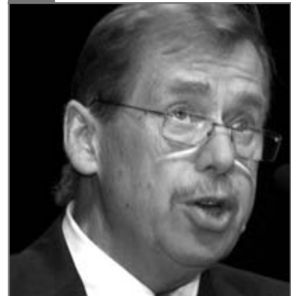
Vaclav Havel ( http://www.ilexikon.com/images/2/2c/Vaclav_Havel.jpg )

Havel a scris piese de teatru în care aducea critici regimului comunist. În 1977 a fost unul dintre fondatorii organizației pentru apărarea drepturilor omului, Charta 77 . În urma activității sale, Havel a fost în mai multe rânduri arestat și întemnițat de către autoritățile comuniste. În noiembrie 1989 a fondat o organizație de opoziție, Forumul Civic . După căderea regimului comunist, a fost ales președinte al Republicii Federale Cehe și Slovace (1989). După destrămarea acestei republici și apariția Republicii Cehe, a fost ales președinte al acesteia din urmă (1993). Havel a contribuit într-o măsură deosebită la restabilirea democrației în țara sa. A militat pentru reconcilierea cu Germania și aderarea Cehiei la NATO și Uniunea Europeană.