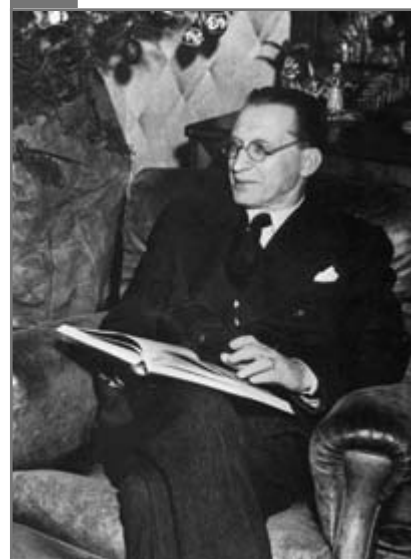
Alcide de Gasperi ( www.proeurope.org/eu_founders.html )

Konrad Adenauer (1876-1967). A fost unul dintre cei mai importanți oameni politici germani de după cel de-al doilea război mondial. S-a remarcat ca primar al orașului Köln (1917-1933). A fost închis într-un lagăr de concentrare de naziști în anul 1944. În calitate de lider al Partidului Creștin-Democrat, a ajuns cancelar al Republicii Federale a Germaniei (1949). În timpul guvernării sale, Germania occidentală a devenit membru fondator al Consiliului Europei (1949), al Comunității Europene a Cărbunelui și Oțelului (1951) și al Comunității Economice Europene (1957).