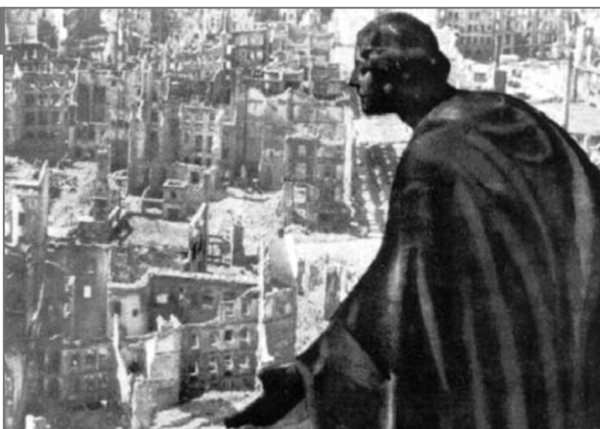
Orașul a fost bombardat de aliați în zilele de 13 -14 februarie 1945. Bilanțul dezastrului: 135.000 morți și 165.000 răniți din 700.000 locuitori. ( http://www.legnano.org/reteciv/scuole/dresda/Nuovo/quadruplice_attacco.htm )