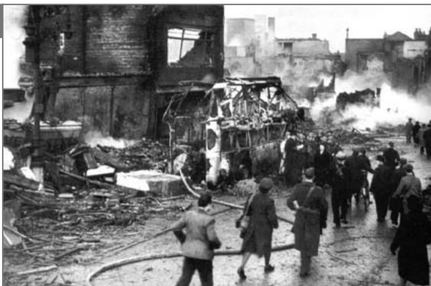
S. Waugh, Ben Walsh, W. Birks, Modern World History , second edition, London, 2002, p. 315

Sursele 5.1 și 5.2 prezintă imagini din două orașe care au suferit de pe urma bombardamentelor asupra civililor. Hitleriștii au provocat distrugeri mari britanicilor din orașul Coventry (1940) și englezii au bombardat Dresda (Germania), nimicind populația neînarmată germană (1945).