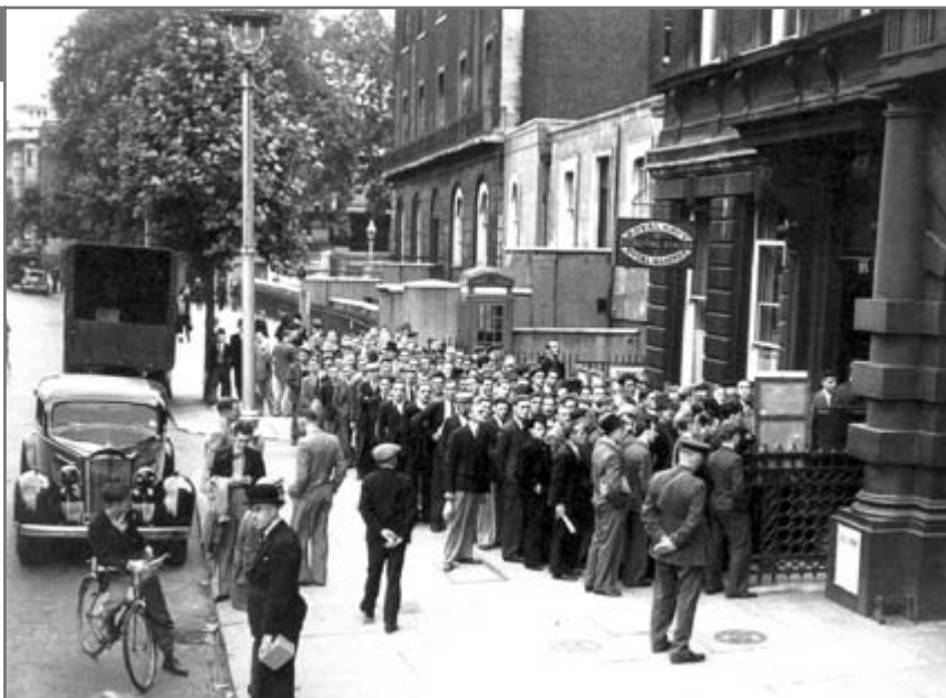
Voluntari pentru recrutare în Marina Regală a Marii Britanii în timpul celui de-al doilea război mondial (S. Waugh, Ben Walsh, W. Birks, Modern World History , second edition, London, 2002, p. 305)